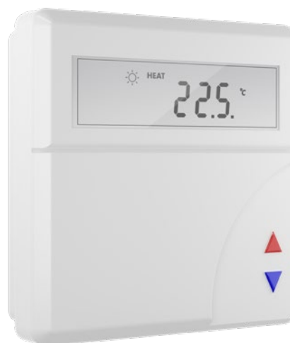
Figur 2. Tillbehör, LUNA d T-CU