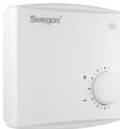
Figur 1. LUNA d RE