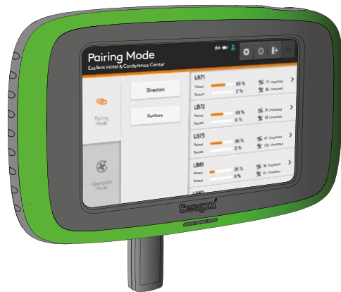
Abb. 1. Handterminal TuneWISE mit montiertem Connect WISE-USB.