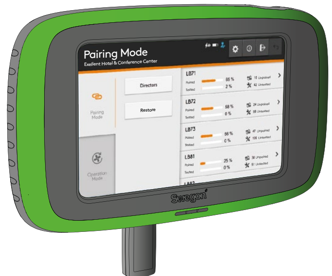
Abb. 1. Connect WISE USB, eingebaut in Swegons Handeinheit TuneWISE.

Diese Erklärung gilt nur dann, wenn die Installation des Produkts gemäß den Anweisungen in diesem Dokument erfolgt ist und keine Änderungen am Produkt vorgenommen worden sind.