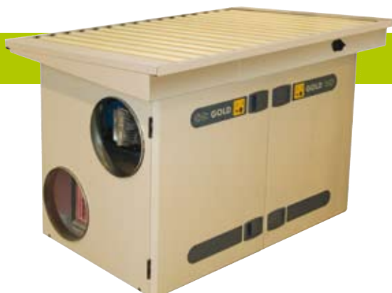
Специальная крыша для монтажа GOLD вне здания, позволяющая использовать площади внутри здания по их прямому назначению.