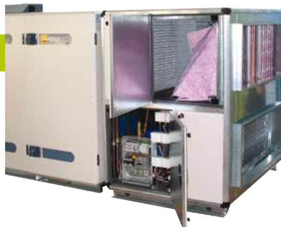
CoolDX - это комплектная холодильная машина прямого испарения, быстро и просто монтируемая к агрегату GOLD.

CoolDX - это холодильная машина прямого/фреонowego испарения, все компоненты которой собраны в едином корпусе, легко монтируемом к агрегату GOLD. Требуется только подключить питание и быстродействующий коммуникационный кабель между CoolDX и GOLD.