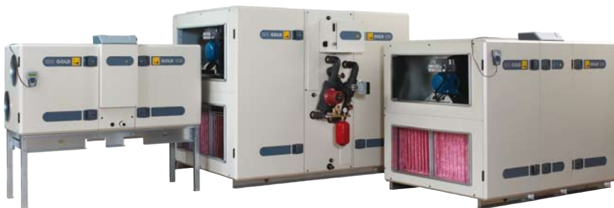
Штатив (04/05 и 08) - принадлежность